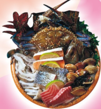
推 你是螃蟹鍋 $698 【藍花蟹、透抽、甜蝦、鯛魚、鮭魚 + 鱸魚、鮑魚、蛤】