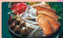
養的好鮮鍋 $398 【鯛魚、鮮蚵、鮭魚、透抽、鱸魚、甜蝦】任選二 + 蛤