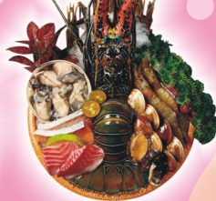
我是龍蝦鍋 $798 【青龍、蛤、蚵、甜蝦、鯛魚 + 鮭魚、鮑魚】