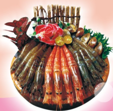
推 牠是大蝦鍋 $678 【大草蝦、阿根廷紅蝦 + 甜白蝦、蛤】